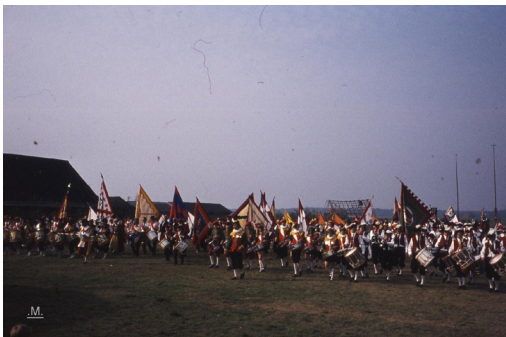
Op de foto de massale opmars van de deelnemende gilden. Hiermee wordt een gildefeest officieel geopend. De gilden stellen zich – na afloop van de optocht – aan één zijde van het veld op en trekken – op commando – in één linie naar voren. Vervolgens wordt door alle vendeliers een massale vendelgroet gebracht. Op de gespiegelde foto vlnr de gilden van Soerendonk, Budel (let op de korte rokjes bij de vrouwelijke tamboers!), Zesgehuchten, Geldrop, Maarheeze, Leende en Strijp.