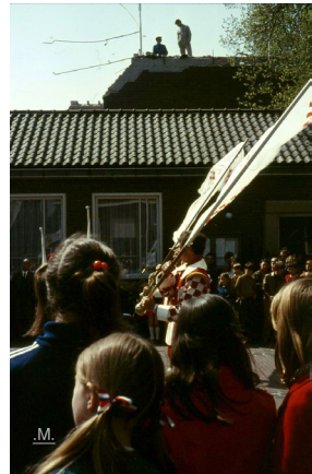
Waarschijnlijk koninginndag. Niet voor iedereen een vrije dag, gezien de werkers op het dak.