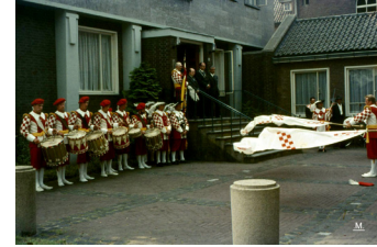
Waarschijnlijkop kermismaandag 1970. Sjerpdragers zijn bij koninginndag niet aanwezig, Het Leendse gilde ontbreekt.