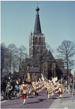
Mogelijk dat dit wel een foto is van een optreden tijdens Koninginndag. Fietsje met rood-wit-blauw tussen de spaken. En het lijkt erop dat aan de kapiteinspiek een oranje strik is bevestigd.